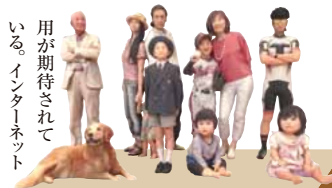
3Dスタジオ プチモ福岡 (運営：株式会社エイチツー)

3Dスタジオで撮影した3Dデータはフィギュア作成に限らず、幅広い分野で活用できる。中でもコンピューター技術でつくれた仮想現実環境で疑似体験ができる仮想現実(バーチャルリアリティ：VR)分野での応